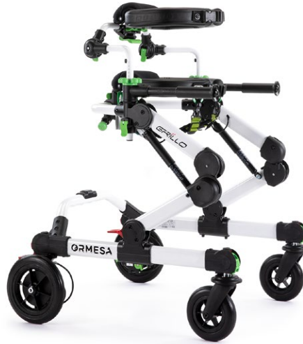
FDA Zertifiziert USA

Grillo ist vielseitig und anpassbar dank austauschbaren Teilen, ohne Einsatz von Werkzeugen für verschiedene Krankheitsbilder geeignet.